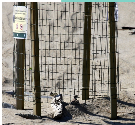
Niño protexido de pillara papuda ( Charadrius alexandrinus ).