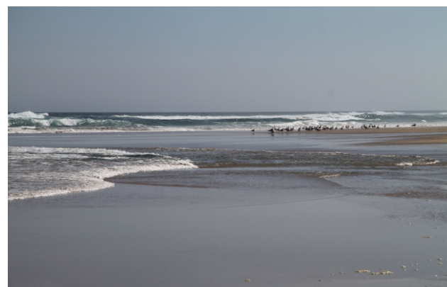
Praia de Baldaio coa marea baixa.