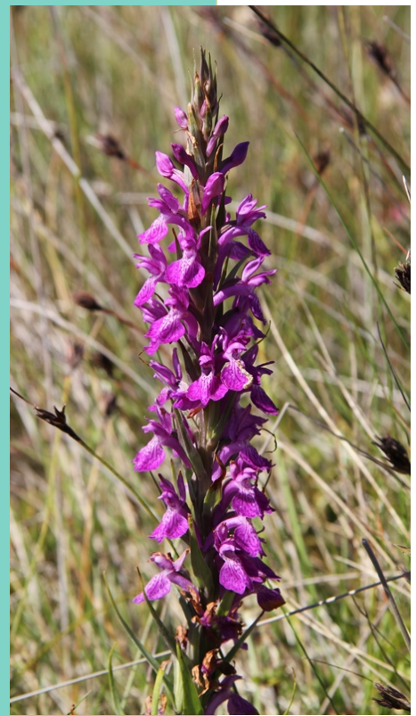
Orquídea ( Dactylorhiza elata )