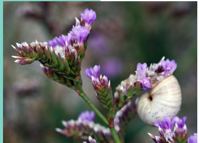
Herba salgada ( Limonium vulgare ), unha planta que se desenvolve en ambientes onde se mestura auga doce e salgada.