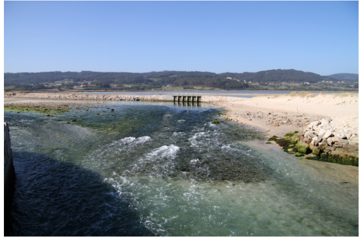
Canle de desaugue da lagoa.