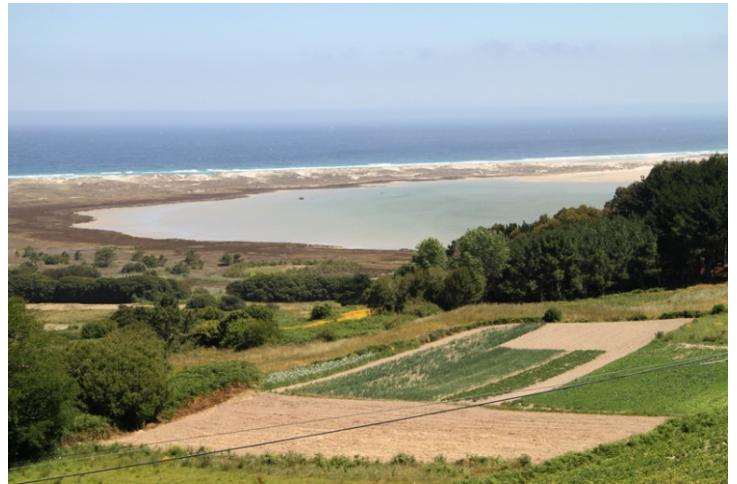
Vista desde o castro de Castrillón.