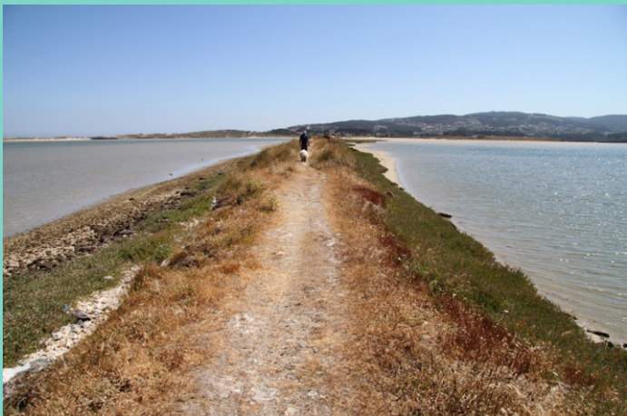
Vista da lagoa desde o interior.