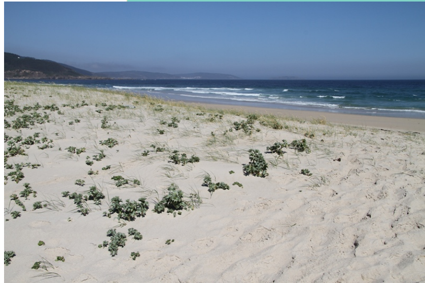
Vexetación nas dunas fixas.