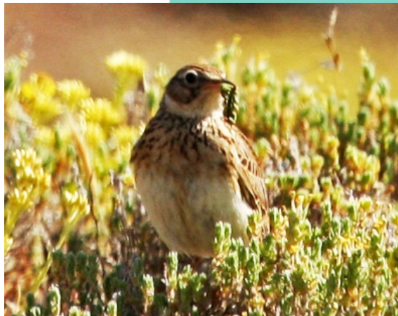
Laverca ( Alauda arvensis ), unha ave de campos aberto que se pode ver no contorno da lagoa.