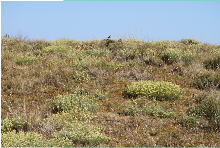
Vexetación nas dunas fixas.